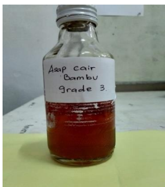
Gambar 1. Asap cair grade 3