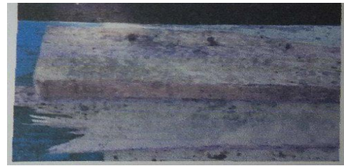
Gambar 4. Kayu yang tidak diolesi asap cair

Struktur kayu yang tidak memiliki serat akan menghasilkan kualitas yang rendah dimana fungsi mekanisme kayu menjadi mudah diserang rayap dan jamur, kayu menjadi mudah rapuh. Sedangkan kayu yang dioleskan dengan asap cair memiliki struktur yang masih tetap utuh dan tidak mudah rapuh, hal ini dikarenakan kandungan fenol dan keasaman pada asap cair dapat mencegah pertumbuhan mikroba dan mikroorganisme dan dapat memperbaiki struktur dari kayu.