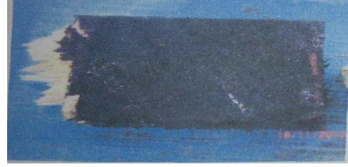
Gambar 3. Kayu yang diolesi asap cair